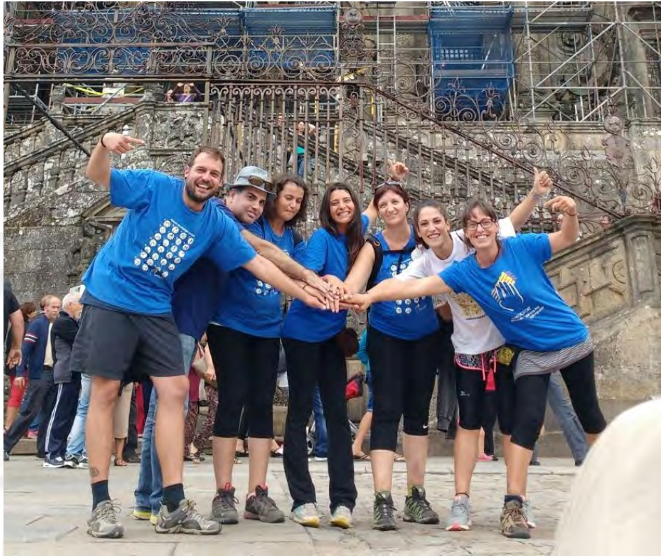
El grupo de la expedición de A Santiago por la sordoceguera, a su llegada a la Plaza del Obradoiro